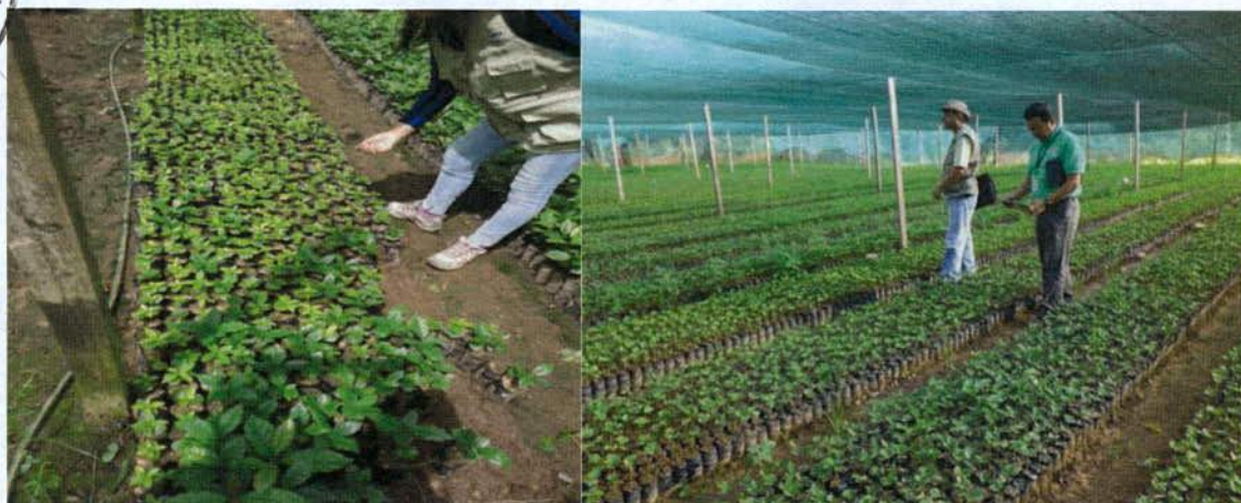
Anexo 9: Vivero en Centro Poblado de las Palmas de Ipoki