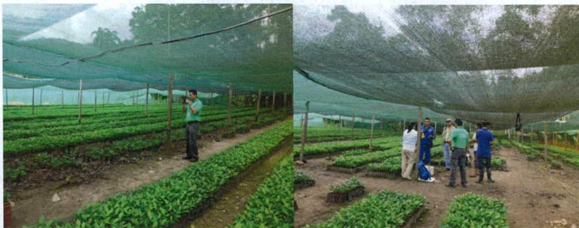
Anexo 8: Vivero en Centro Poblado Menor “Primavera”