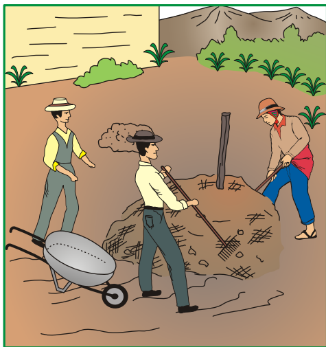
Fig. 2. Mezcla de los insumos